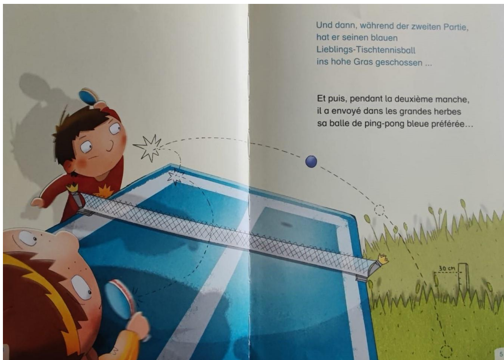
Lena Hesse, Das kleine Wunder. Le petit miracle, München : Edition bi:libri, 2012.

Welche Transferstrategien bzw. sprachlichen Unterschiede könnten Ihre Schülerinnen und Schüler anhand der folgenden zwei Seiten des zweisprachigen Bilderbuchs lernen?